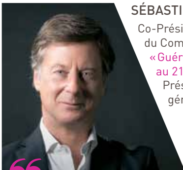
SÉBASTIEN BAZIN Co-Président du Comité de Campagne « Guérir le cancer au 21 e siècle » Président-directeur général d'AccorHôtels

“ S'investir contre le cancer aux côtés des médecins chercheurs les plus déterminés à faire la différence, c'est croire que la vie peut gagner, être convaincu que Gustave Roussy a l'énorme potentiel de trouver les traitements qui gommeront la peur que génère le mot cancer. Échanger avec les équipes de médecins et de chercheurs m'a permis de comprendre que les programmes de recherche menés à Gustave Roussy coûtent très chers et que les aides gouvernementales ne suffisent plus à financer cet espoir en progrès. Sans le soutien des donateurs, ce qui peut être accompli en un an prendra beaucoup plus de temps et cela au détriment des patients. Quand la vie ne tient qu'à un fil, si le prix du fil c'était vous ? ”